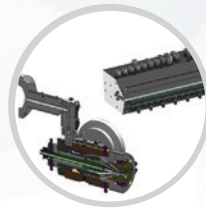
Konstruktion und Herstellung von Kunststoff-Extrusionswerkzeugen (Köpfe, Düsen usw.)