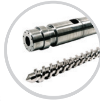
Schnecken und Zylinder