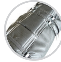
Wärmeisoliermatten für Maschinen