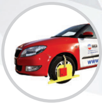
Sicherungskrallen für Fahrzeuge